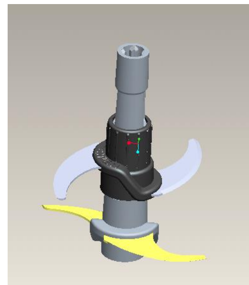
Основное и вспомогательное лезвие в сборе