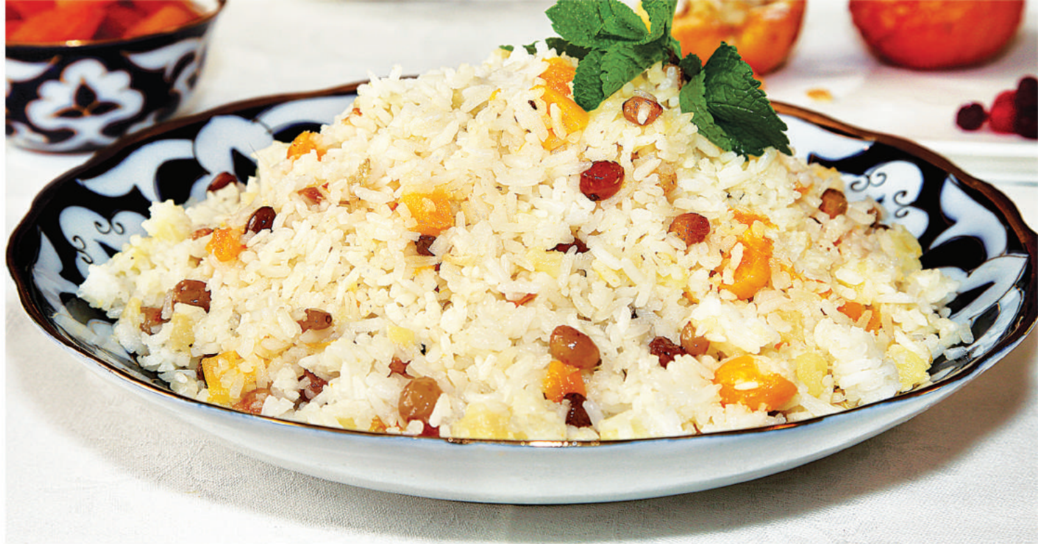
Рис с сухофруктами