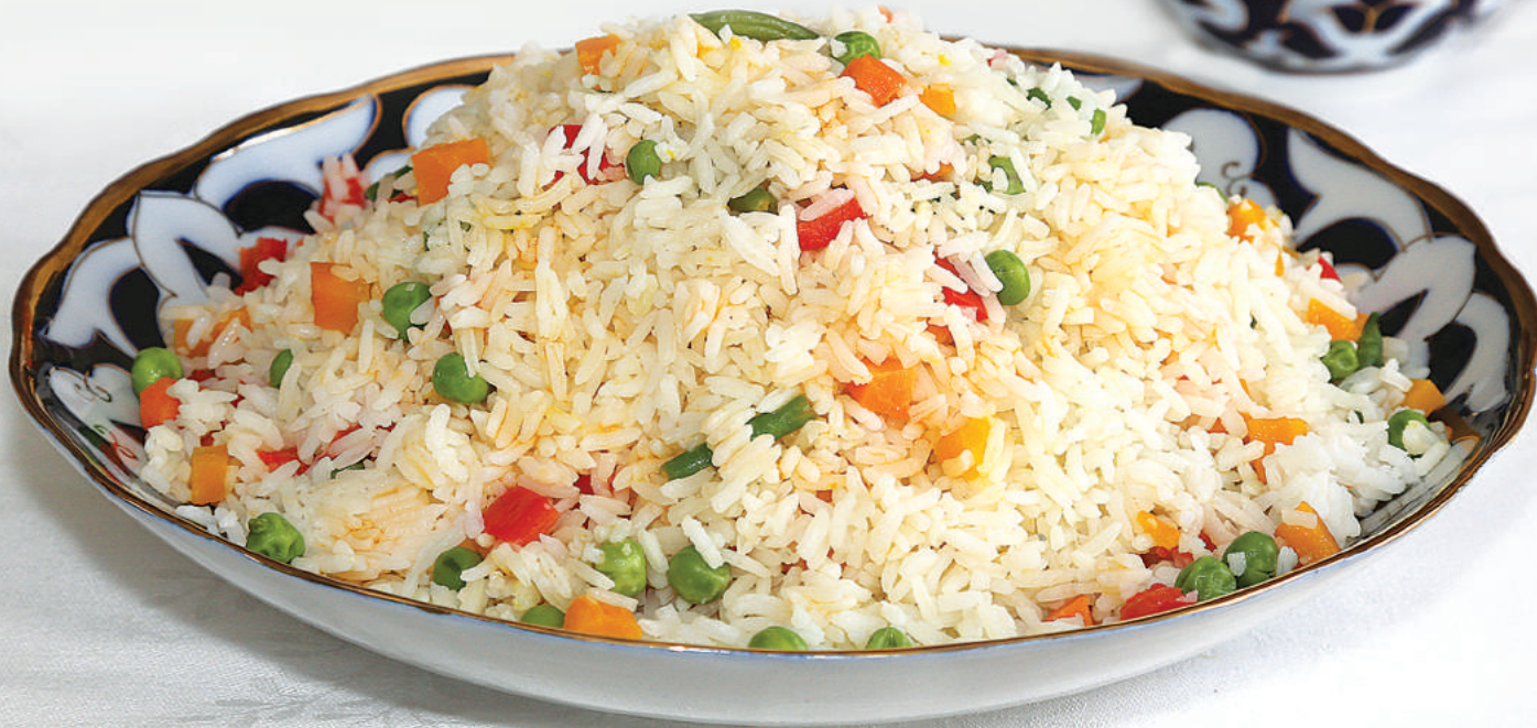
Рис с овощами