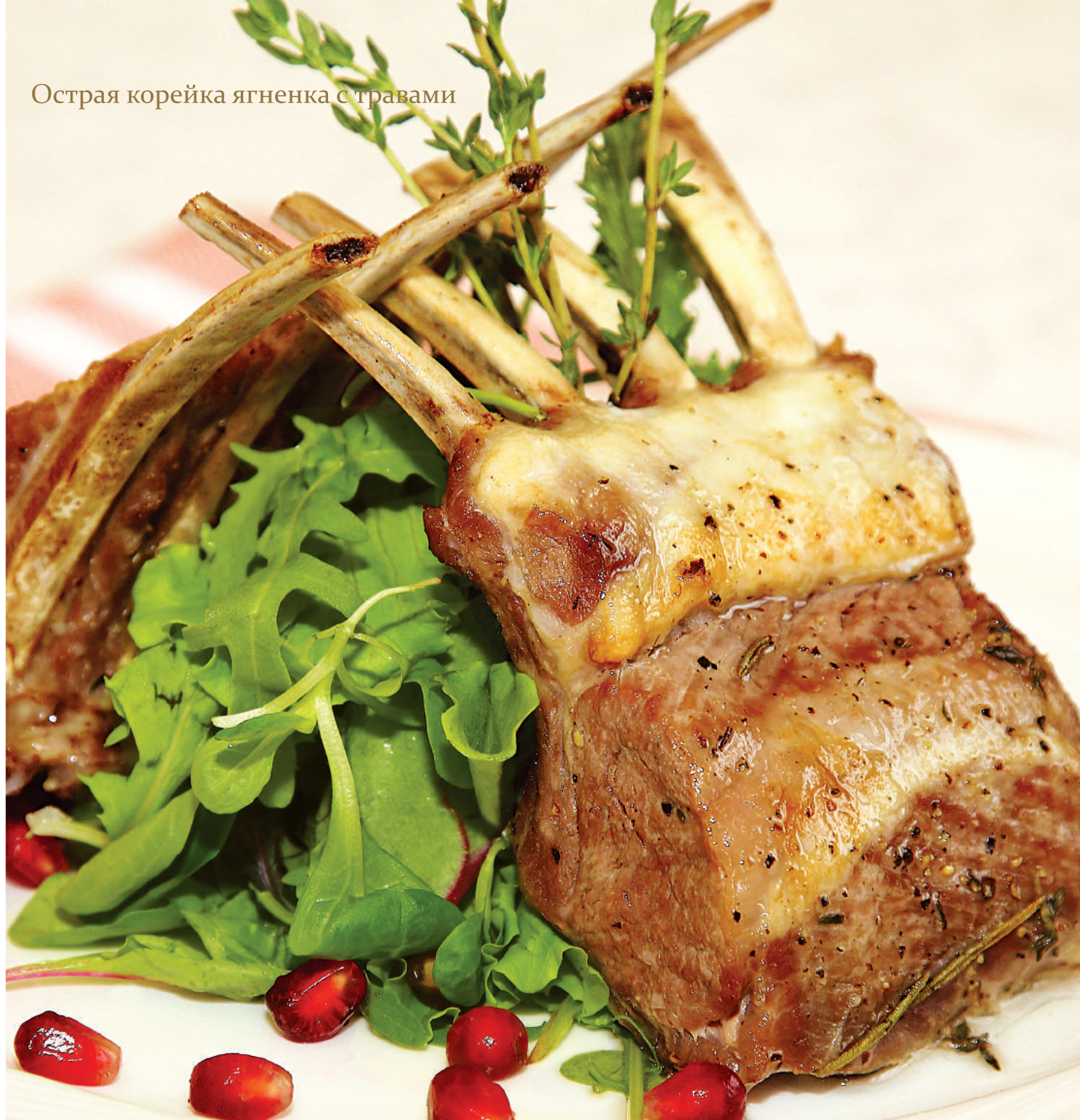
Острая корейка ягненка с травами