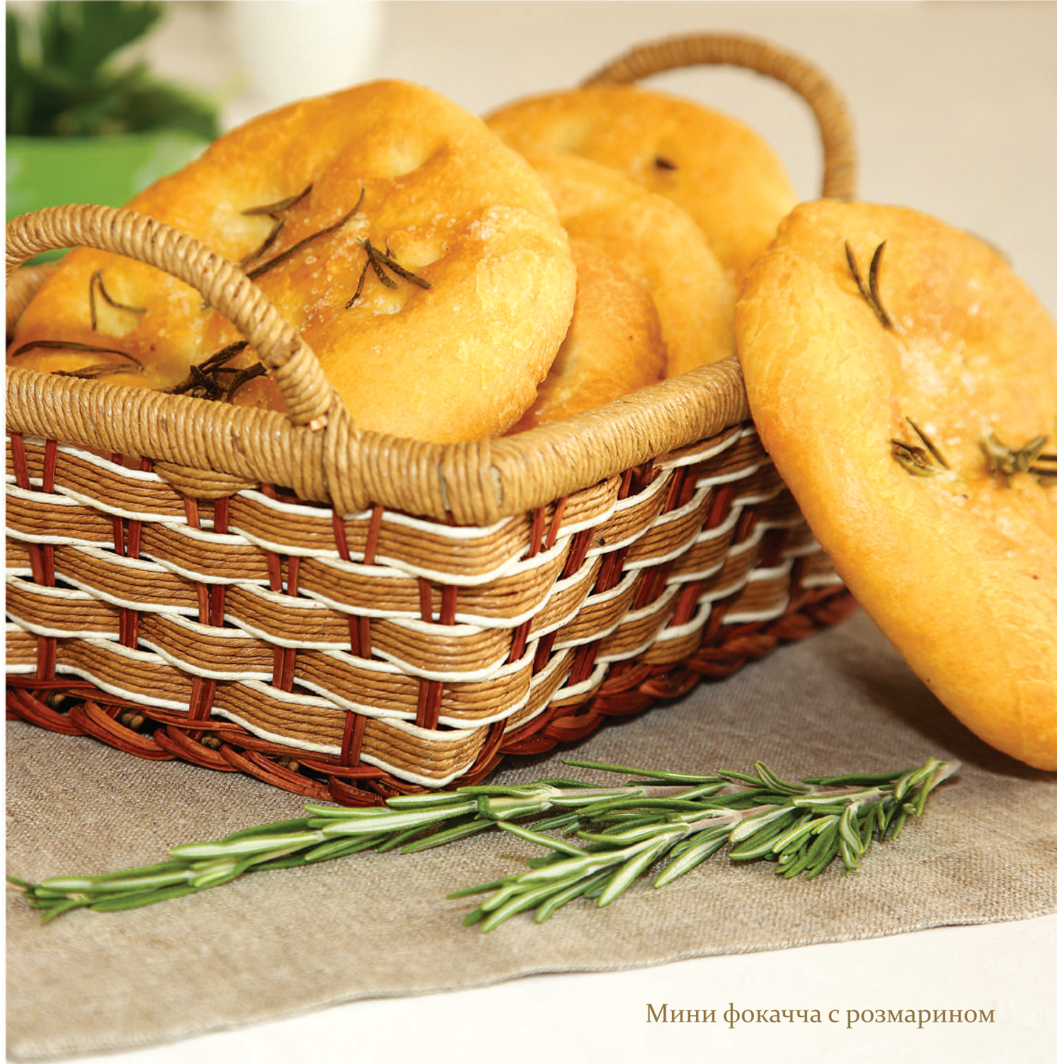
Мини фокачча с розмарином